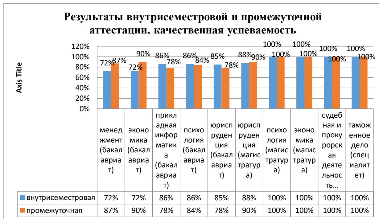
Рис 4. Результаты внутрисеместровой и промежуточной аттестации 2021-2022 учебный год, качественная успеваемость, %

3. Важной формой в подготовке и становлении специалиста является практическая подготовка, которая организуется при проведении практики. В процессе прохождения практики обучающимся прививаются умения и навыки в решении широкого спектра вопросов в сфере своей будущей профессиональной деятельности, что позволяет обеспечить их высокую конкурентоспособность на рынке труда и успешную профессиональную деятельность.