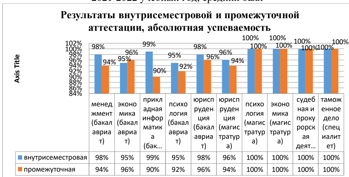
Рис 3. Результаты внутрисеместровой и промежуточной аттестации 2021-2022 учебный год, абсолютная успеваемость, %